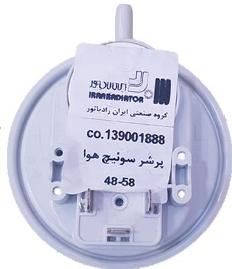
پرشر سویچ هوا با پاسگال ۴۸-۵۸