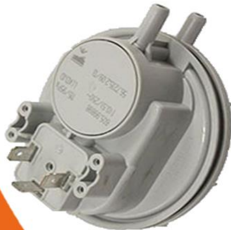
پرشر سویچ هوا با پاسگال ۴۴-۵۴