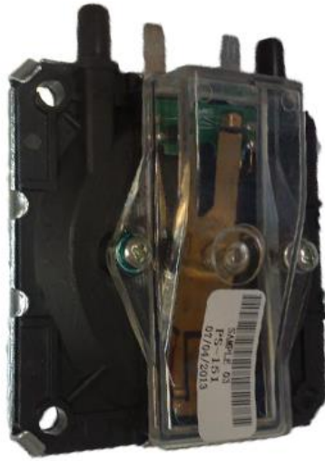
پرشر سویچ هوا همه کاره باسگال ۱۵۱