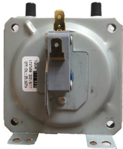
پرشر سویچ هوا همه کاره باسگال ۳۹-۶۰